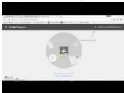
Studenti - primo accesso a GSuite a Classroom