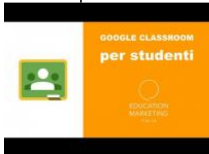
Gestione Classroom per studenti e famiglie