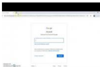
Primo accesso a G Suite

In questa sezione ne sono forniti alcuni video, ma tanti altri sono facilmente individuabili con semplici ricerche online.